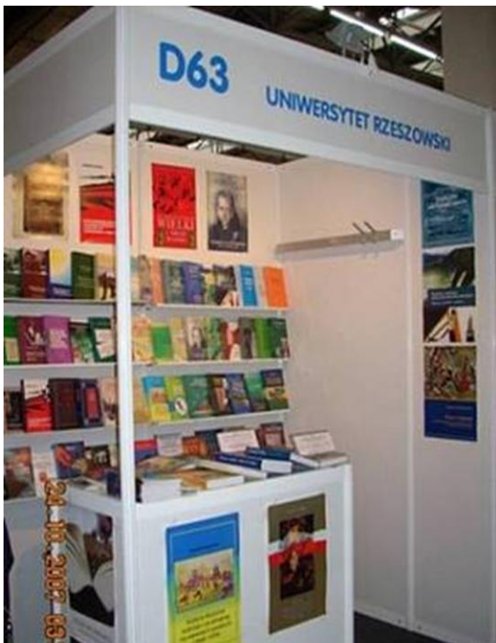
Krakowskie stoisko Wydawnictwa UR - widok ogólny

11. Targi Książki w Krakowie odbyły się w dniach 25-28 października na terenie obszernej hali wystawienniczej przy ulicy Centralnej 41a. Patronem honorowy targów byli: Wojewoda Małopolski, Marszałek Województwa Małopolskiego oraz Prezydent Miasta Krakowa. W trwającej przez 4 dni imprezie wzięło udział 438 wystawców. Motto przewodnie targów brzmiało „Szczęśliwe znalezienie dobrej książki może zmienić przyszłość duszy” (Marcel Proust). Organizatorzy szacują, że tegoroczną edycję Targów w Krakowie odwiedziło ponad 22 tys. sympatyków książki. Czytelnicy spotkali się z ponad 230 autorami,