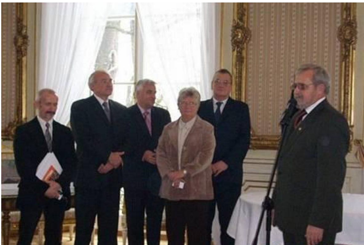
Zdjęcie z ceremonii przyznania nagród i wyróżnień Academia 2007, która odbyła się w Sali Złotej Pałacu Kazimierzewskiego UJW.