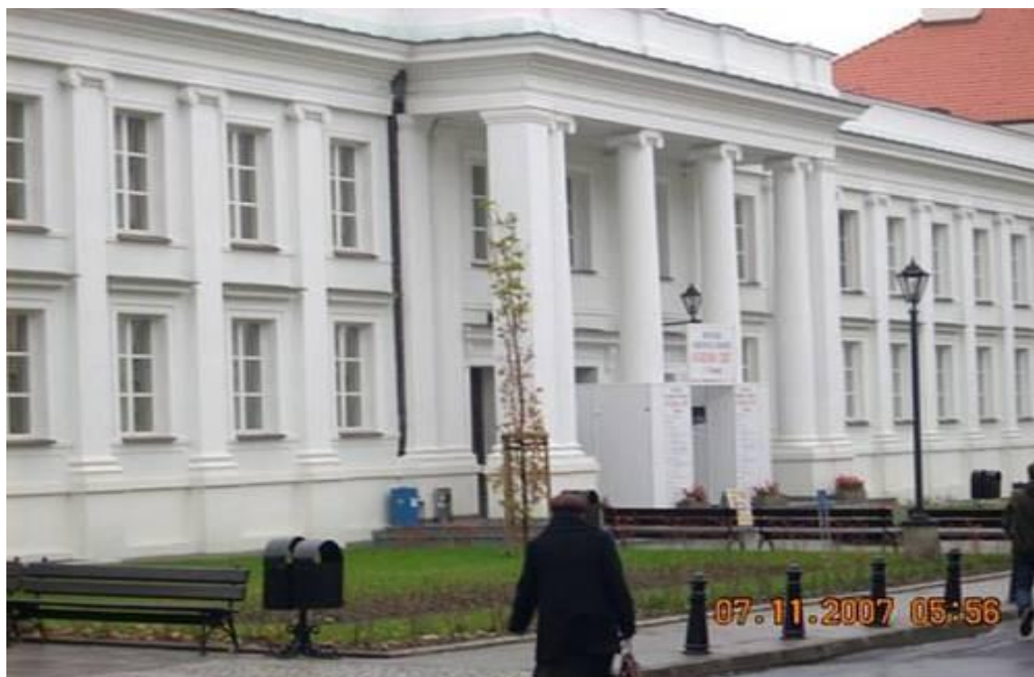
Auditorium Maximum Uniwersytetu Warszawskiego - miejsce odbywania I Targów Academia

Kolejną nominację przyniosły I Krajowe Targi Książki Akademickiej i Naukowej ACADEMIA w Warszawie (7-9 listopada 2007) umiejscowione w Auditorium Maximum Uniwersytetu Warszawskiego przy ulicy Krakowskie Przedmieście 26/28. Uroczyste otwarcie odbyło się 7 listopada w Sali Złotej Pałacu Kazimierzowskiego, podczas którego ogłoszono wyniki Konkursu na Najlepszą Książkę Akademicką i Naukową ACADEMIA 2007. Miło nam poinformować, że wśród wyróżnionych tytułów znalazła się praca zbiorowa pt. Złota księga historiografii